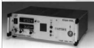
Источники питания для зарядки конденсаторов Серия HSK от 2000 В до 65000 В от 100 Дж/с до 20000 Дж/с