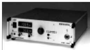
Высоковольтные источники питания Серии HCL и HCN От 3500 В до 150000 В от 14 Вт до 4200 Вт