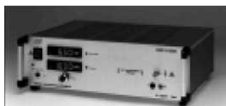
Высоковольтные двухполярные источники питания Серия HCB От 1250 В до 20000 В от 1,4 Вт до 200 Вт