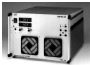
Источники питания с линейной регулировкой Серия NLN От 6,5 В до 500 В от 35 Вт до 1400 Вт