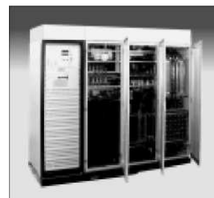
Источники тока для сверхпроводящих катушек и магнитов Серия NTS до 10000 А до 250 кВт