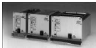
Кассеты высокого напряжения EURO-кассеты Серия HCE 125 В до 35000 В / 7 Вт и 35 Вт