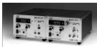
Средневольтные источники питания Серии MCL и MCN От 125 В до 2000 В от 14 Вт до 4200 Вт