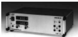
Низковольтные источники питания Серия NTN С двойной стабилизацией от 6,5 В до 350 В от 35 Вт до 100 кВт