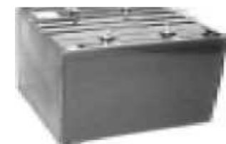
Высоковольтные изолирующие трансформаторы Серия HTS 50 кВ изоляция до 3000 ВА