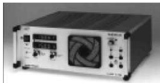
Низковольтные двухполярные источники питания Серия NLB От \pm 6,5 В до \pm 350 В От 35 Вт до 1400 Вт