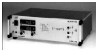
Источники питания с автоматическим переключением напряжения Серия NCA / MCA От 55 В до 3000 В от 750 Вт до 9000 Вт