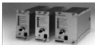
Кассеты высокого напряжения IMS-кассеты Серия HCN 7E 125 В до 35000 В / 7 В т