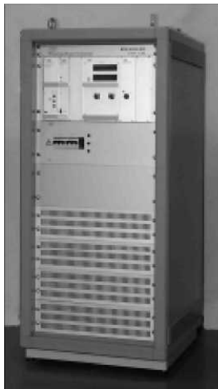
Низковольтные источники питания Серия NUN С тиристорной регулировкой От 6,5 В до 350 В от 7кВт до 100кВт